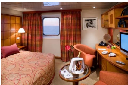
Oben: Kabine Explorer Class Unten: Internetcafé/Bibliothek: