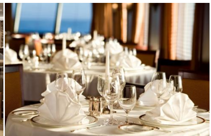
Oben und unten: Restaurant