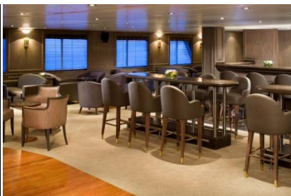
Oben: Panorama Lounge Unten: Observation Lounge